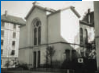
Kapelle Klingentalstrasse Ecke Brantgasse