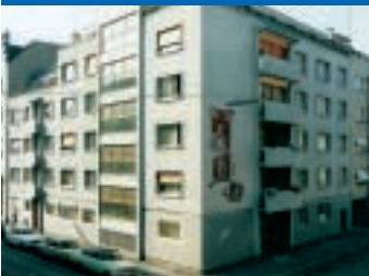
Gustav Benz Haus 1964