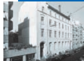
Brantgasse vor dem Erweiterungsbau