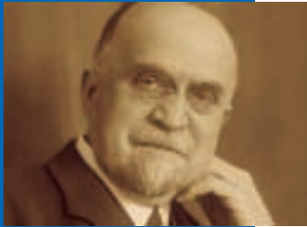
Gustav Benz 1866–1937