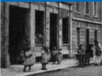
Stadtleben Klingentalstrasse 1890