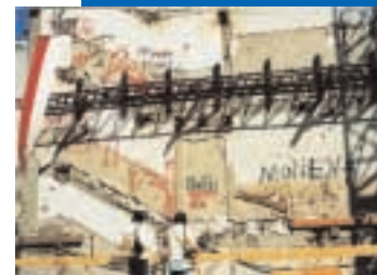
Baustelle Brantgasse 1987